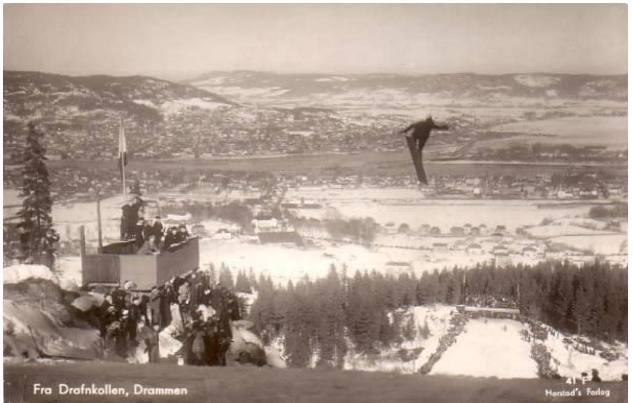
Fra Drafnkollen, Drammen