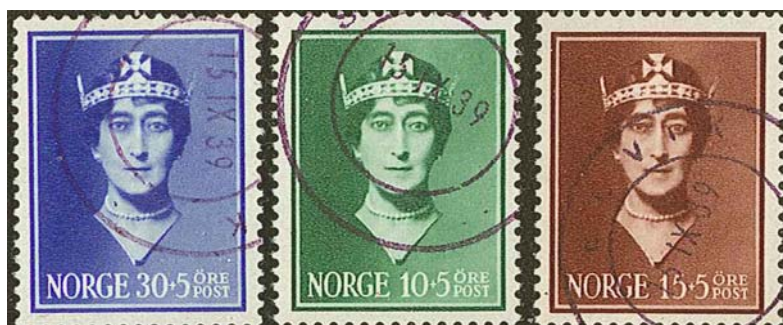
Eksempler på Maud merker stemplet med helforfalsket Svelvik stempel